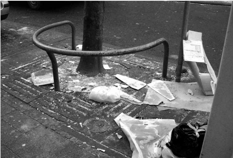
Müll in der Oberen Hellmundstraße