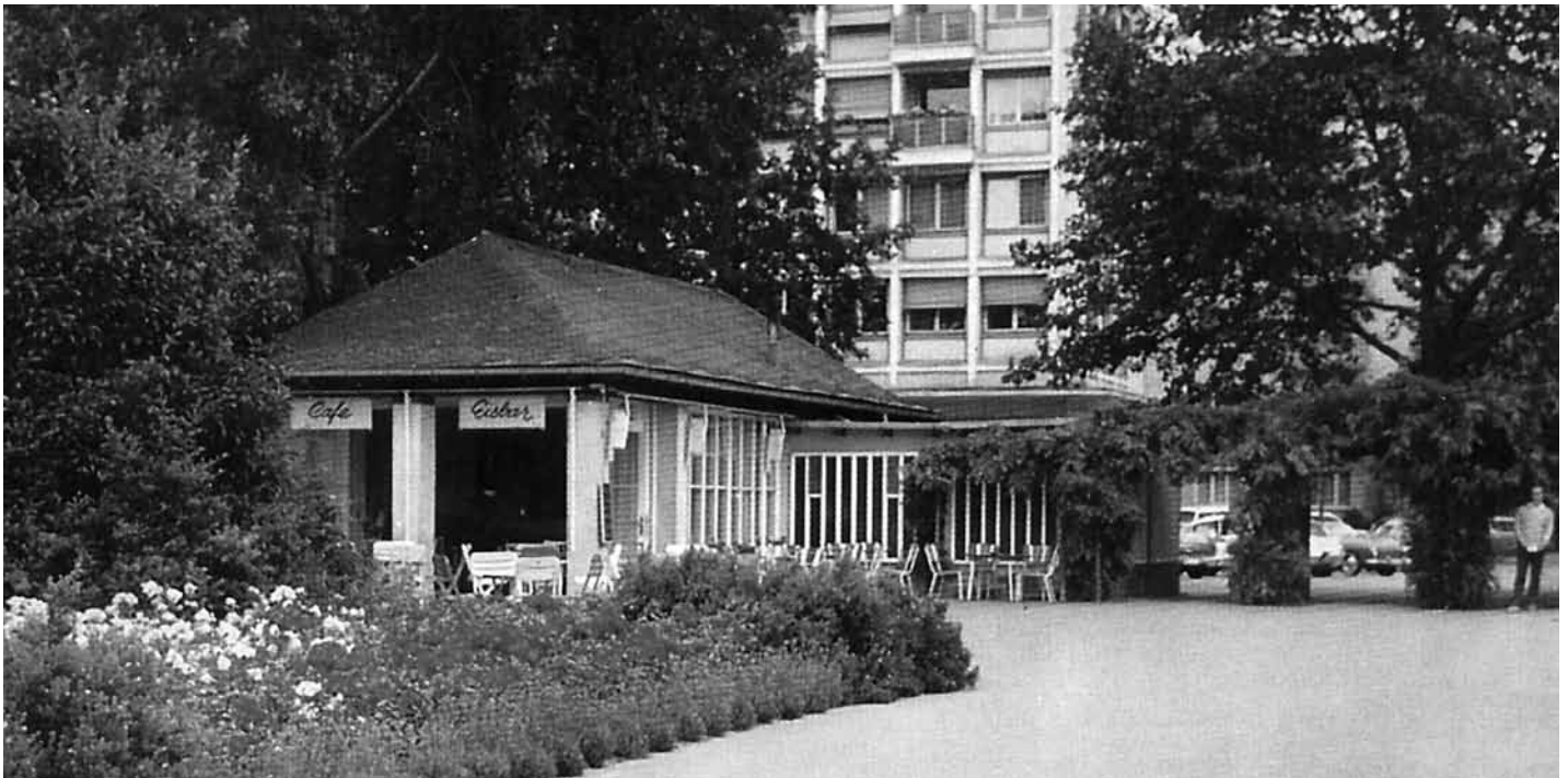
Der Pavillon in den Herbert-Anlagen um 1968