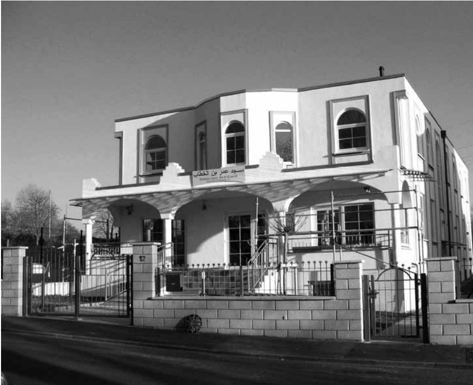
Die Moschee in Biebrich