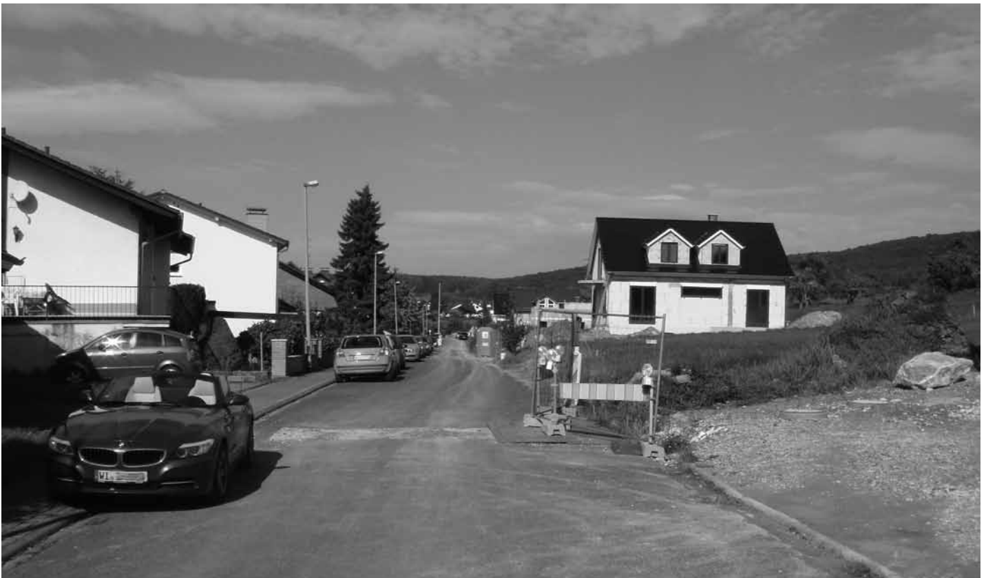
Die Ahornstraße in Breckenheim

eine Hausbesitzrate von 86,5%. Das Bauland an der Ahornstraße wurde zunächst einmal von Wassermassen überflutet, es war eben ein Biotop. Trotzdem: vier neue Baugebiete will man haben; die CDU hat, von der SPD unterstützt,