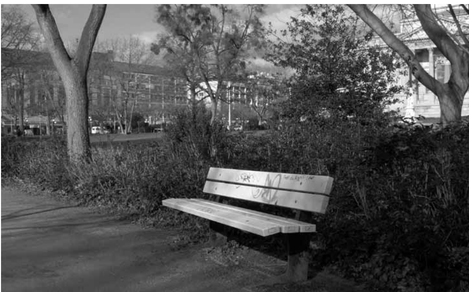
Der Warme Damm war im März diesen Jahres Schauplatz eines grausamen Verbrechens.