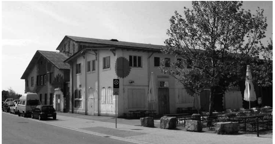
Der alte Schlachthof ist bald Vergangenheit.

Die Grünen haben lustigerweise im Planungsausschuß den Antrag auf