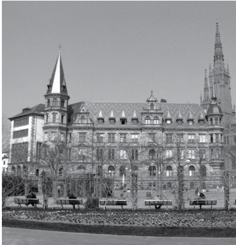
Wie gehts weiter im Rathaus?

Die Grünen waren heillos zerstritten, beschimpften einander, hatten in der Koalition Zugeständnisse gemacht, die man nicht mehr als grüne Politik bezeichnen konnte. Sie hätten eigentlich vom Wähler abgestraft werden müssen. Dann kam Fukushima, und die Grünen konnten, obwohl es in Wiesbaden kein Atomkraftwerk gibt, die Zahl ihrer Mandate drastisch erhöhen. Man muß daraus lernen, daß bei einer Kommunalwahl die kommu-