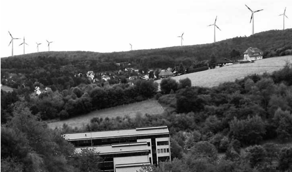
Simulation von Windkraftanlagen