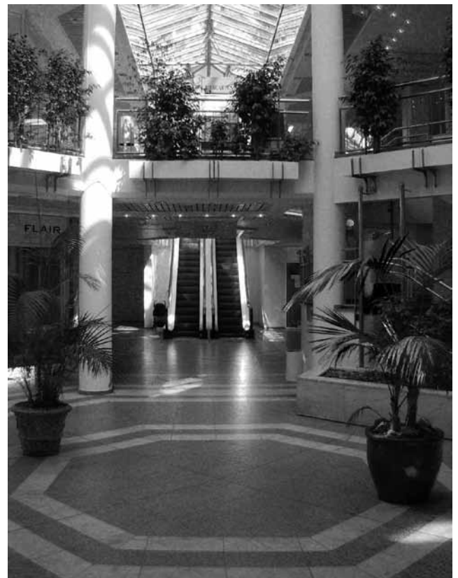
Das innere der Mauritiusgalerie

Für die Unterbringung der Stadtbibliothek sprechen aber keineswegs so zwingende Gründe, sie würde auch nur die Hälfte des zur Verfügung stehenden Raumes beanspruchen. Die Option mit dem Stadtmuseum in der Mauritius-Galerie sollte man sich auch dann offenhalten, wenn hier zunächst die Stadtbibliothek einzieht. Beispielsweise