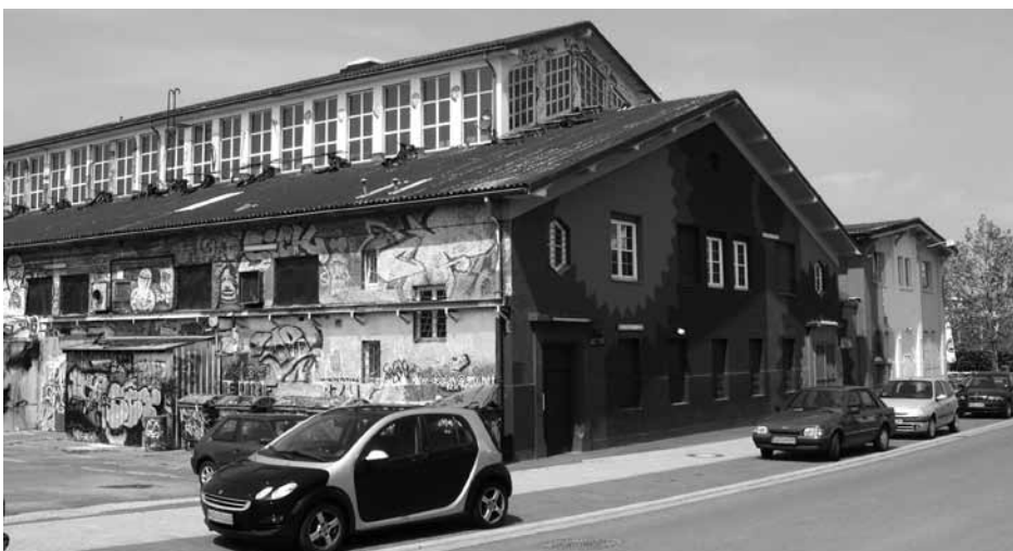
Man kann nur hoffen, daß die neue Schlachthof-Halle attraktiver wird.

zu zahlen sind. Als im Jahr 2010 die Debatte über Sanierung oder Neubau begann, hieß es, die Sanierung würde ca. 7,5 Millionen kosten und die SPD brachte für den Neubau die Zahl 8 Millionen ins Spiel. Die SEG sprach dann von 11,5 Millionen plus möglicher 2 Millionen Mehrwertsteuer. Im Bauausschuß wurden die folgenden aktuellen Zahlen genannt: 14,8 Mio. Euro ohne Mehrwertsteuer, 16,9 Mio. mit Mehrwertsteuer. Wir sind also beim Doppelten der Sanierung oder darüber angelangt. Herauskommen wird ein Schuppen, der vermutlich dann in Kürze wieder baufällig sein wird. Und das in einem für Wiesbaden wichtigen Eingangsbereich. Der Denkmalschutz war gegen eine Verblendung des Baus, die nicht zum Wasserturm passt, hatte aber nach unserer Kenntnis sehr wohl weitergehende Verbesserungswünsche, die nicht berücksichtigt wurden. Das ganze ist ein stadtplanerisches Husarenstück, unausgereift, rechtlich bedenklich und im Ergebnis sicher kein Gewinn für das Stadtbild.