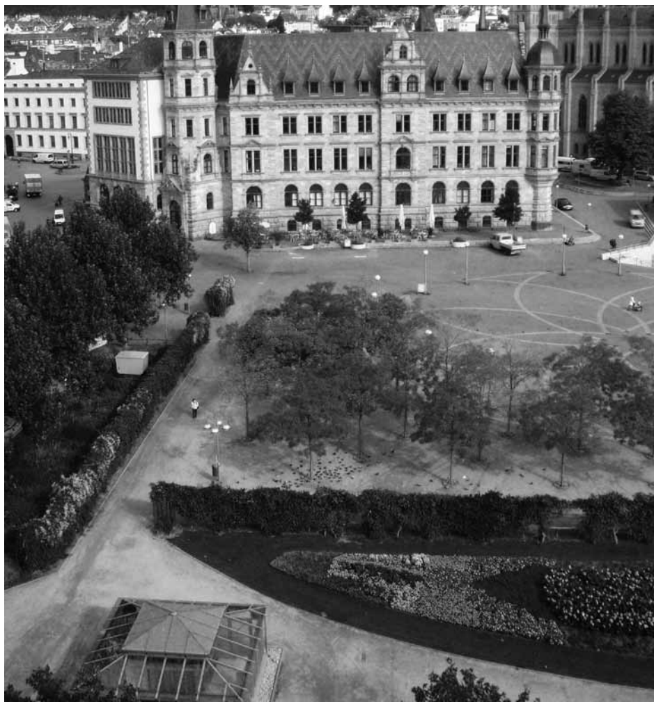
Die Bebauung des Dernschen Geländes wurde durch eine Bürgerinitiative in den 90er Jahren verhindert.