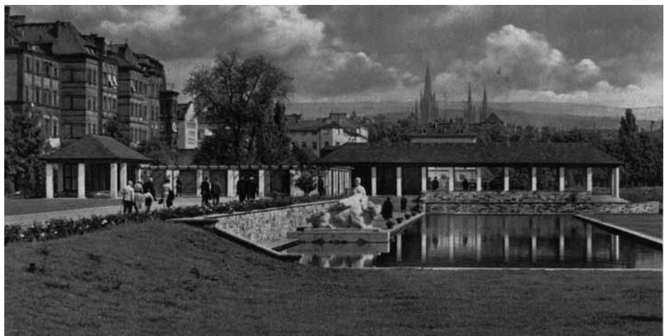
Die Wandelhallen um 1938

Ursprünglich gehörte das Gelände der Kita zu den 1937 gebauten Herbert-Anlagen. Hier befand sich in unmittelbarer Nachbarschaft zur Wandelhalle ein später als