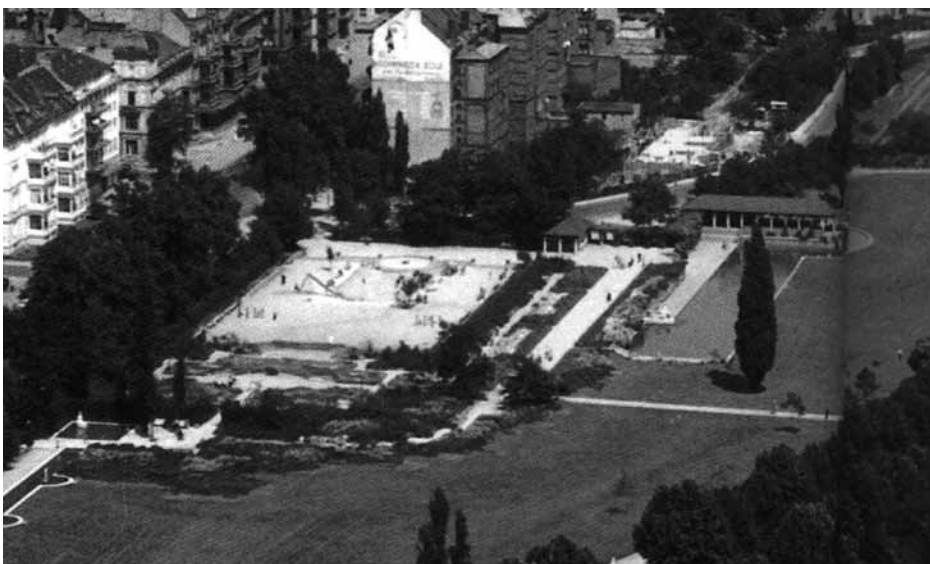
Luftbild des Spielplatzes Ende der 1950er Jahre