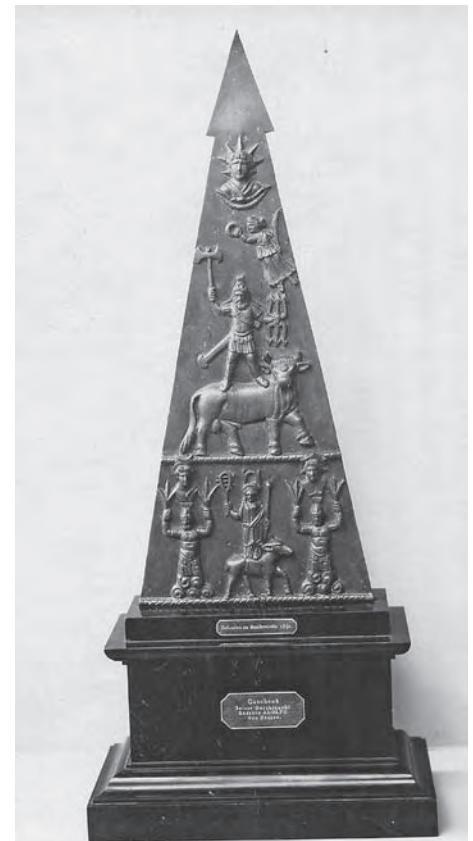
Weihrelief an Jupiter Dolichenus aus dem 2. Jahrhundert n. Chr. aus Heddernheim.

ähnlich eiskalte Richtung geht. Zu dieser Tendenz paßt es auch, daß man Herrn Rattemeyer in dem Bestreben unterstützt, die Sammlung Nassauischer Altertümer loszuwerden, die ins Landesmuseum gehört und von der nur ein sehr kleiner Teil für ein Wiesbadener Stadtmuseum in Frage käme.