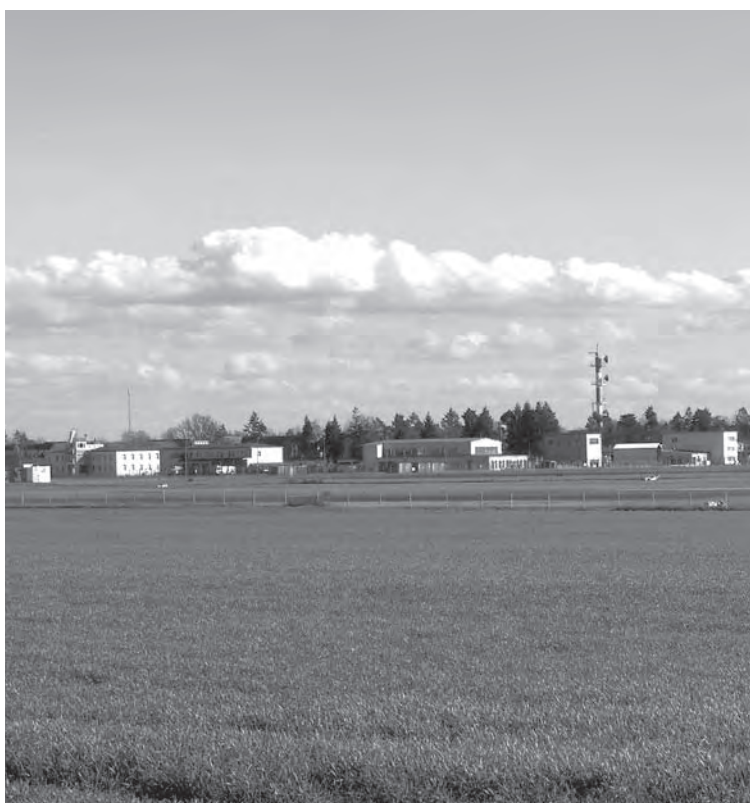
Die Felder um den Flughafen Erbenheim sollen bebaut werden

Schon in den letzten Monaten sind schwerwiegende Zukunftsentscheidungen getroffen worden, die Wiesbaden verändern werden: Es wird, dem Stadtverordnetenvotum (auch unserem) zum Trotz, ein Mammutkohlekraftwerk auf der Ingelheimer Aue gebaut, direkt gegenüber dem Biebricher Schloß. Im Osten von Wiesbaden werden die amerikanischen Streitkräfte, die ihr Hauptquartier hierher verlegen, größere Gebiete zur Bebauung erhalten, dabei handelt es sich um wertvolles Ackerland mit teilweise geschützter Fauna und ein klimatisch wichtiges Entstehungsgebiet für Kaltluft. Die Stadt hat in dieser Sache nur geringe Einflußmöglichkeiten, aber uns fehlte der Protest, und die Sicherheitsprobleme wurden ignoriert. Weiteren Landschaftsverbrauch lehnt die BLW-Fraktion auf je-