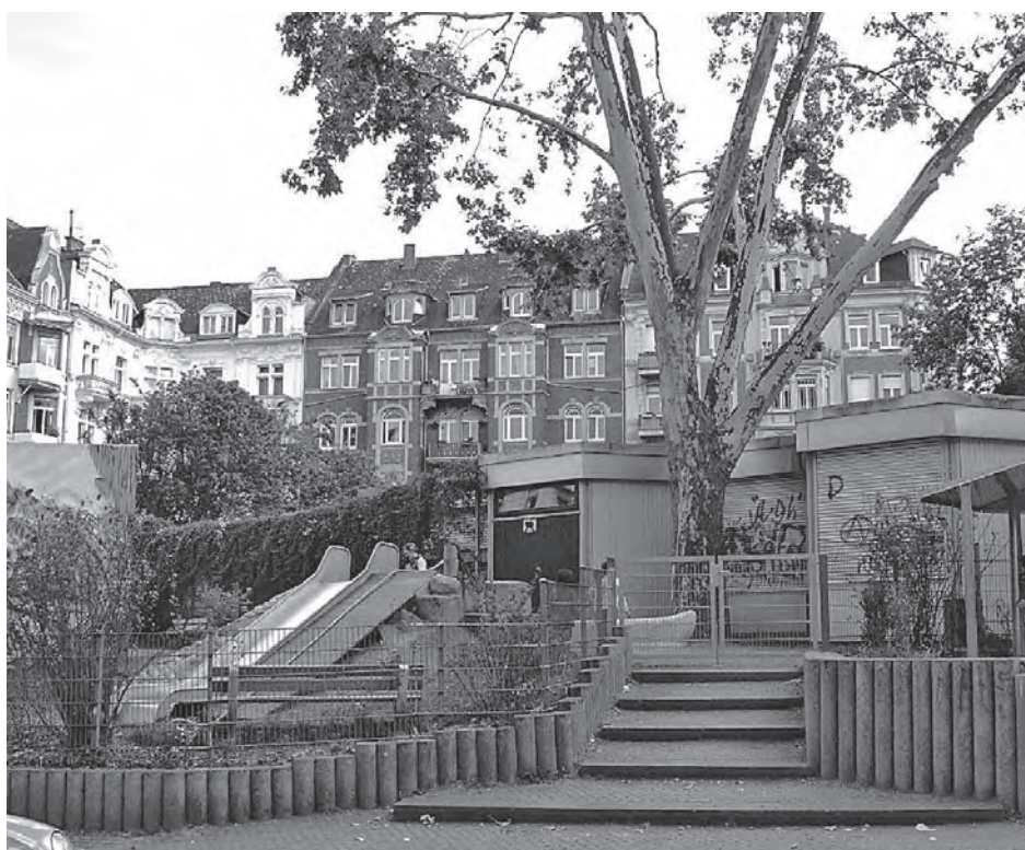
Der Luxemburgplatz ähnelt heute eher einem Hochsicherheits-trakt als einem Platz

Bürgerliste Wiesbaden V.i.S.d.P.: Dr. Michael von Poser Ausgabe 1/2007 (Nr. 2) Auflage : 20000