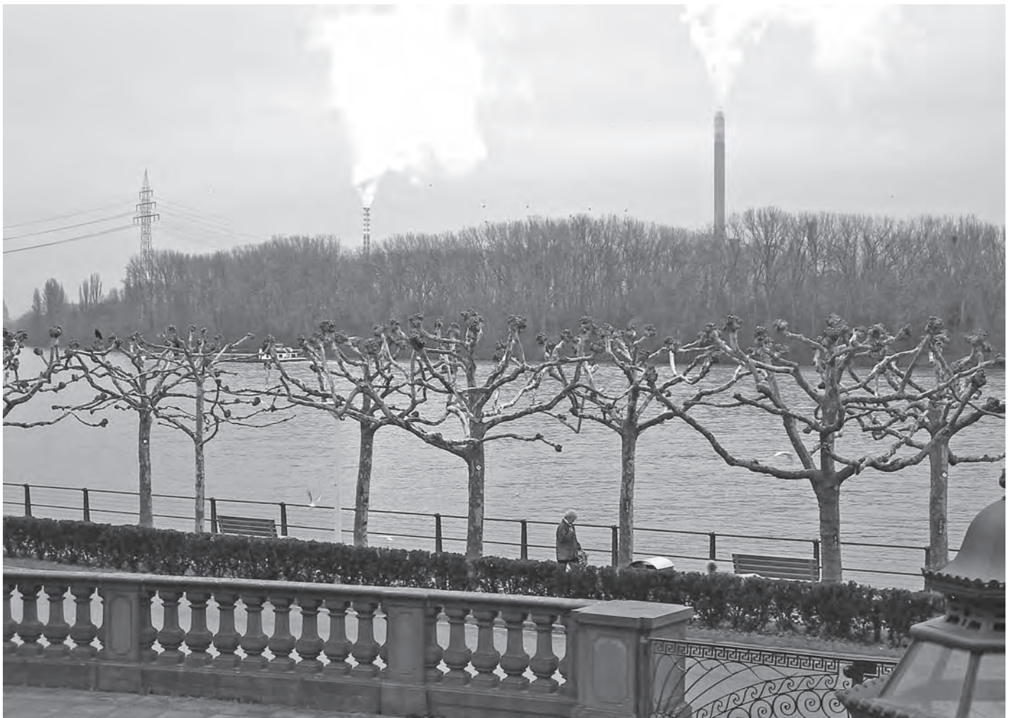
Blick vom Biebricher Schloß auf die Kraftwerksinsel Ingelheimer Aue

rüber entfachen müssen. Im Mainzer Stadtrat hat eine Koalition aus CDU, SPD und FDP die Entscheidung für das Kraftwerk gefällt. Warum gab es keine Konsultationen auf Parteiebene, wo Wiesbadener Interessen vertreten wurden? Das Baurecht lag nun einmal in Mainz, aber Wiesbaden wird von der Luftverschmutzung betroffen und auch stadtplanerisch von den Koloß auf der Ingelheimer Aue. Soweit man sehen kann, ist überhaupt nichts geschehen, einen Wiesbadener Standpunkt geltend zu machen. Die viel zu späte Entscheidung des Wiesbadener Stadtparlaments ist einfach übergangen worden. So