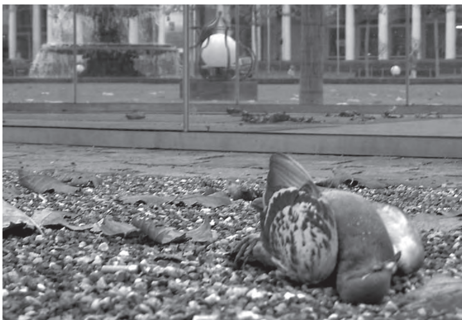
Eine der toten Tauben, vom 17.11.2006

Dieser Antrag wurde im Umweltausschuß einstimmig angenommen.