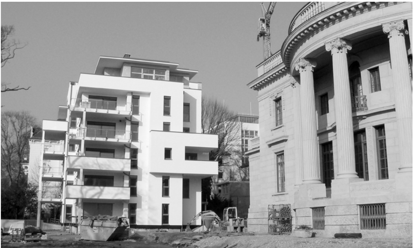
Neubauten an der Paulinenstraße. Sieht so gelungene Stadtplanung aus?

richtet sich hauptsächlich gegen den Mangel an architektonischer Vielfalt, den zu großen Einfluß des Architektenbeirates auf das Wiesbadener Stadtbild. Wenn nun aber vorgerechnet wird, wie wenig Mitglieder des Architektenbeirats durch städtische Aufträge verdienten und wie benachteiligt sie seien, dann müssen wir darauf hinweisen, daß uns diese Rechnung nicht überzeugt. Denn nach unserer Auffassung wären dabei auch die Fälle zu berücksichtigen, wo Mitglieder des Architektenbeirats Honorare nicht von der Stadt, sondern von Investoren erhalten, die für die Stadt tätig werden. Großprojekte wickelt man ja inzwischen meist in dieser Form ab.