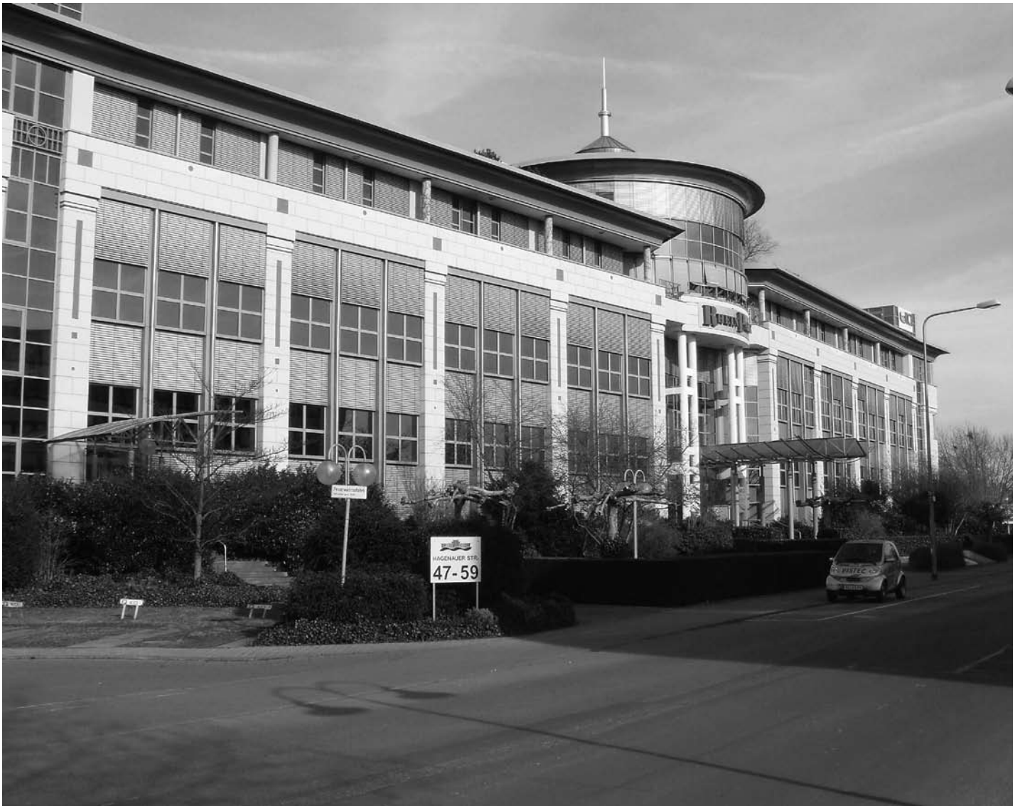
RheinPark Hagenauer Straße 47-59

Moderne Architektur kann dagegen in einem Neubau- oder Gewerbegebiet sehr reizvoll sein. Wir denken, daß es für jeden Ort auch eine spezielle Lösung geben muß.