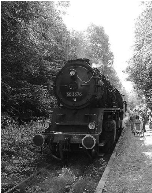
Die Nassauische Touristikbahn