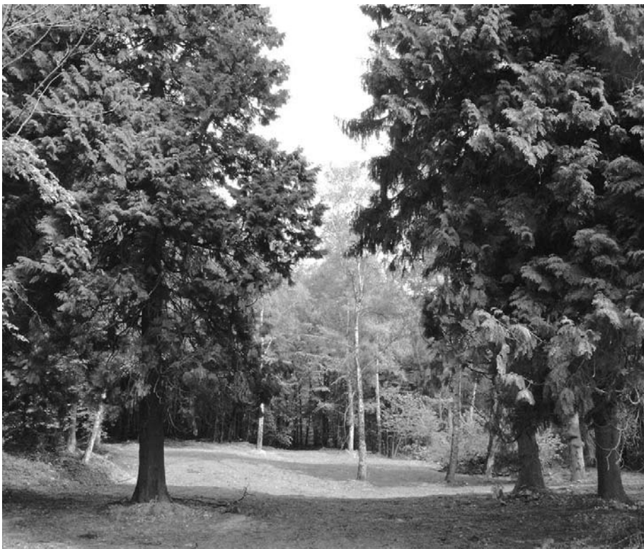
An dieser Stelle stand bis 2003 das Chausseehaus 1

So fehlt z.B. bei dem Objekt Waldstraße die Hausnummer, die Sommerstraße 41 sucht man im amtlichen Stadtplan der Landeshauptstadt Wiesbaden vergeblich. Aber vielleicht wird die Straße in den nächsten Jahren soweit bebaut, daß auch eine Nummer 41 dort entstehen kann. Die Krönung ist jedoch das Chausseehaus 1, dabei handelt es sich um das ehemalige Kurhotel Taunusblick. Dieses wurde im Jahre 2003 abgerissen und war auch nicht im Besitz der Stadt, erstaunlich, daß dennoch Mieteinnahmen zu verzeichnen sind.