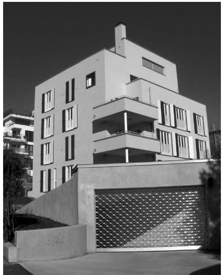
Hier befand sich einst der rückwärtige Garten der Sonnenberger Straße 44