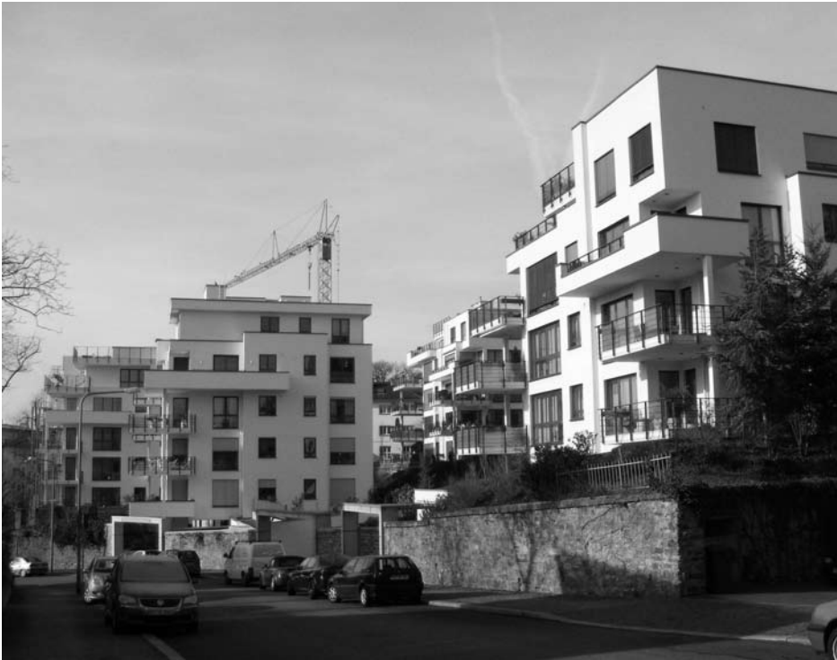
Die Neubauten von der Richard-Wagner-Straße aus

fangreichen zeichnerischen Untersuchungen zur Gebäudetypologie, um bauliche Fehlentwicklungen der frühen 60er