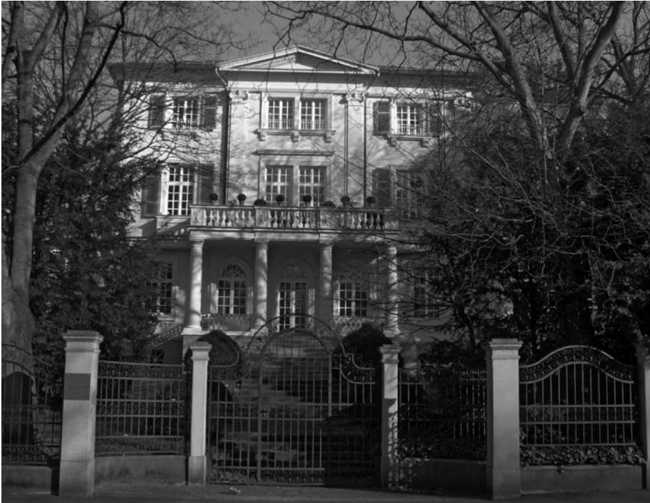
Die Sonnenberger Straße 44