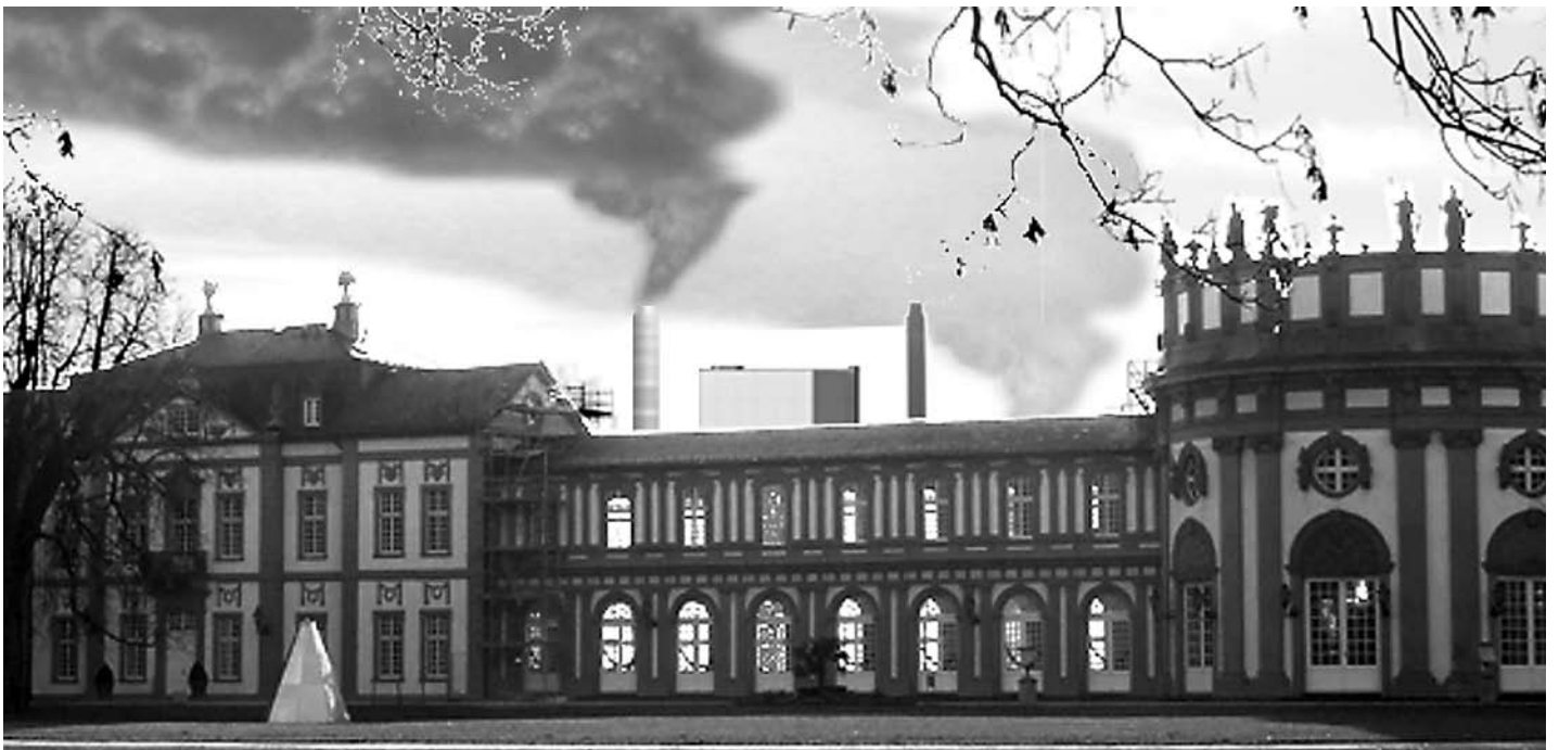
Das Biebricher Schloß mit dem geplanten Kohlekraftwerk im Hintergrund

Ein anderes Beispiel: Die KMW-Kraftwerksgesellschaft, durch ihre Anteilseigner, also Stadt-