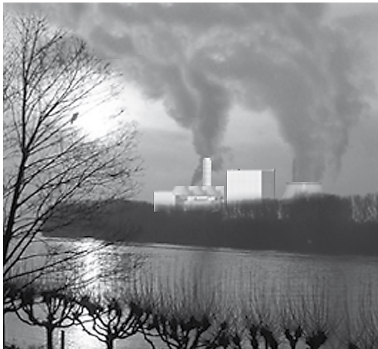
Die Montage zeigt das geplante Kohlekraftwerk am Rheinufer

Die Bürgerliste beobachtet schon seit längerem eine zunehmende Tendenz, Fragen und Belange, die eigentlich genuin öffentlich sind, einfach so umzuetikettieren, daß sie sich flugs in reine Wirtschaftsinteressen verwandeln und damit jene Unangreifbarkeit reklamieren, die dem Gewinnstreben nun mal in einer Marktwirtschaft wie der unseren zukommt. Dagegen wäre erst einmal nichts zu sagen, würde nicht die Sozialbindung des Eigentums und das Mitspracherecht der Öffentlichkeit bei Dingen, die eigentlich alle angehen, gleichzeitig immer kleiner geschrieben: Mit dem Argument „Ich leite ein selbständiges, auf Gewinnerzielung ausgerichtetes Unternehmen und bin nur diesem verantwortlich“ werden zunehmend Versuche der Bürger zurückgewiesen, auf Themen Einfluß zu nehmen, die selbstverständlich öffentliche sind, selbst wenn sie sich heute in unternehmerischer Verpackung präsentieren. Auch hierdurch kann man die Zustimmung zu unserem Gemeinwesen untergraben, fördert Wahlmüdigkeit und Rückzug ins „Was-geht-das-mich-an“,