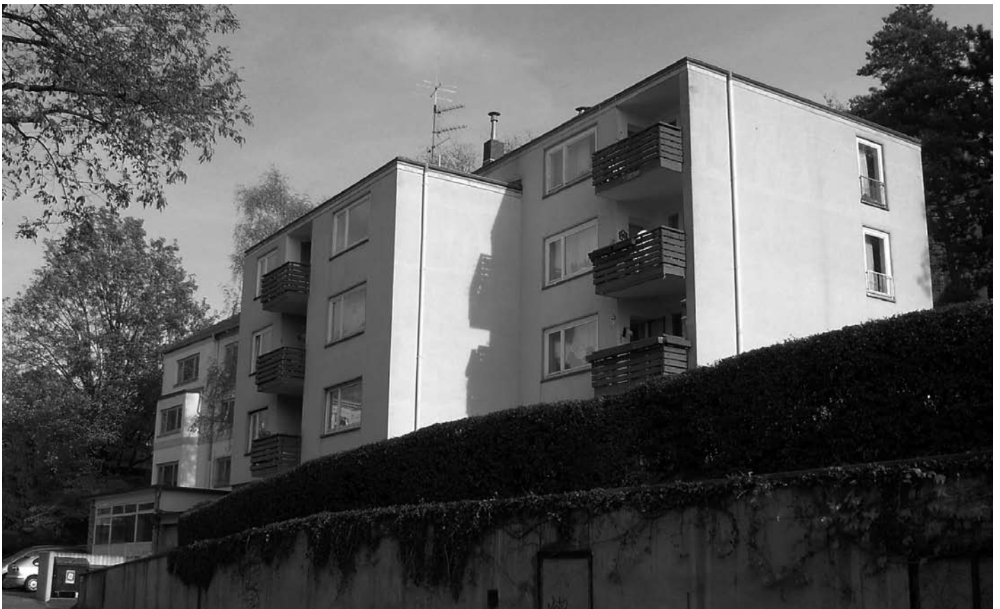
Die Geisbergstraße 17/19 wird in die geplante städtische Immobiliengesellschaft überführt

Weiterhin stellt sich die Frage, wie einer GmbH-Gründung schon verbindlich zugestimmt werden kann, wenn alle erforderlichen Details (z.B. Gesellschaftervertrag bzw. Satzung usw.) noch nicht vorliegen?