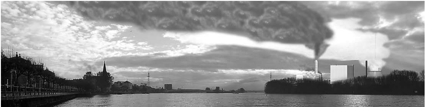
Der Blick auf den Rhein bei Biebrich mit dem geplanten Kohlekraftwerk

hier beginnt sich die Balance zwischen Öffentlich und Privat, Wirtschaft und Gesellschaft gerade gefährlich zu verschieben. Wer glaubt, daß es Kurdirektor und Kraftwerksvorstand schon richtig machen werden, kann sich gemütlich zurücklehnen und auf den nächsten Beschluß à la Nokia warten (auch dieser ganz sicher nur zum Besten des Unternehmens). Aber dann