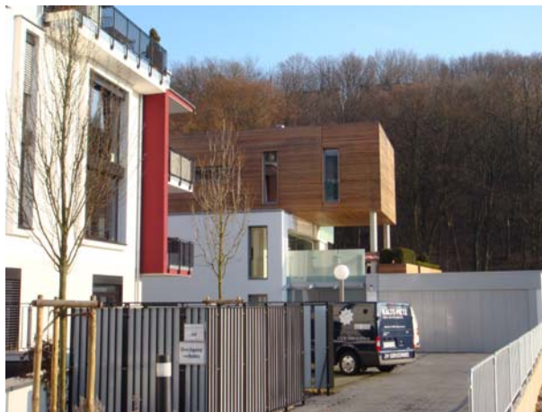
Platz 7: Danziger Straße 66