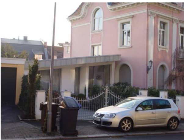
Platz 9: Thomaestraße 1