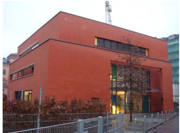
Platz 6: Kindergarten Marktkirche