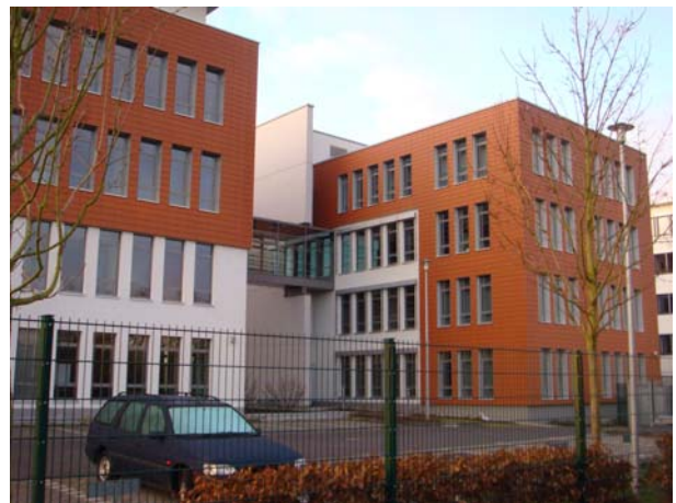
Platz 8: Schufa Schiersteiner Hafen