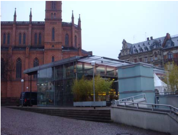
Platz 5: Cafe Lumen